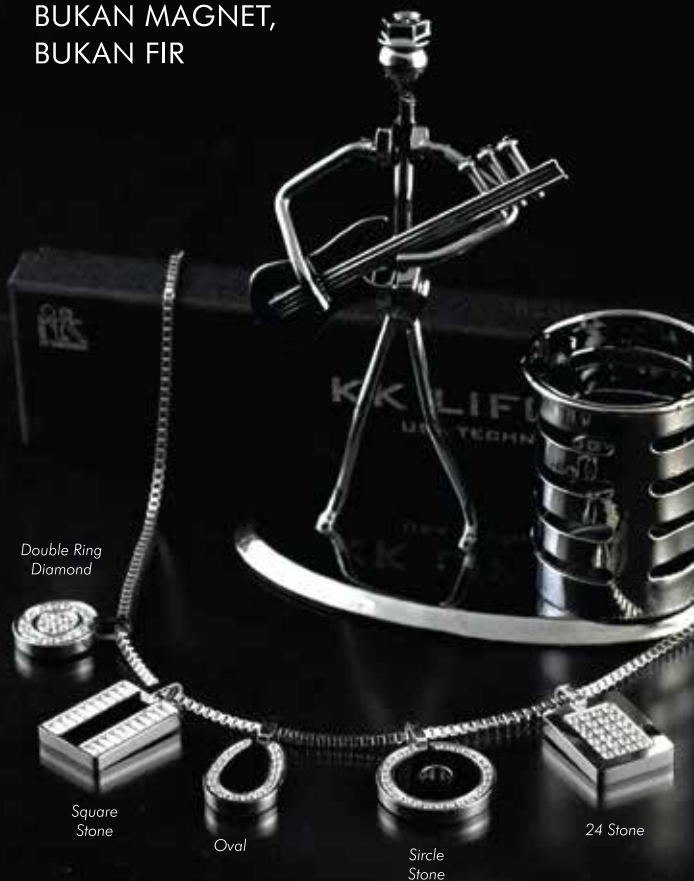
Double Ring Diamond

TEROBOSAN TERBARU, PENYEIMBANG SEGERA MEDAN ENERGI TUBUH BUKAN MAGNET, BUKAN FIR